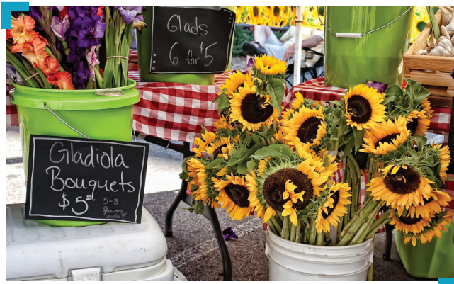
Soutenir les producteurs locaux

Revenir à 350 ppm est une chance unique pour repenser nos communautés, pour une vie plus saine, plus autosuffisante, pour honorer les savoirs traditionnels et indigènes. Nous pouvons cesser de dépendre des sources d'énergie et de la nourriture venues de pays lointains, et faire pousser notre propre nourriture, prendre nos vélos et utiliser les transports en commun, dépendre des systèmes d'énergie comme le vent et le soleil, et créer des économies qui ne dépendent pas d'une croissance infinie. Ce genre de solutions aide à créer des communautés plus respectueuses de notre climat, mais aussi plus saines pour les poumons de nos enfants et notre bien-être.