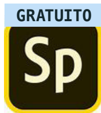
Adobe Spark Video